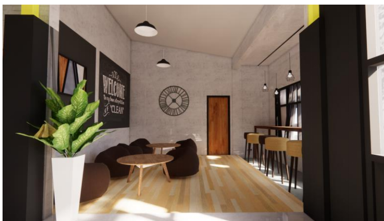
Gambar.18. Desain keempat ruang indoor bagian utara