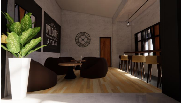
Gambar.14. Desain ketiga ruang indoor bagian utara

Permasalahan: Penataan area duduk di depan pintu masuk yang terkesan menghalangi sirkulasi, serta pemilihan material, warna dan furnitur masih kurang sesuai dengan konsep gaya industrial.