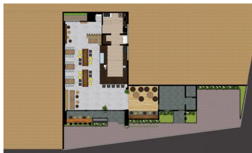
Gambar.15. Layout desain keempat