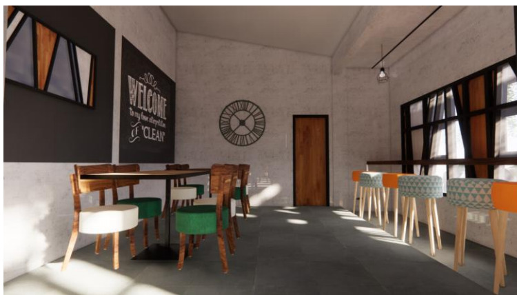
Gambar.6. Desain pertama ruang indoor bagian utara