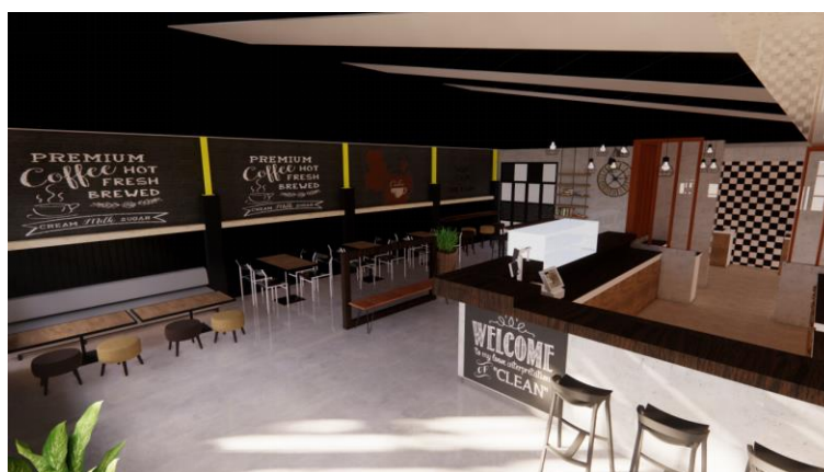
Gambar.13. Desain ketiga ruang indoor bagian selatan Sumber : Penulis, 2020