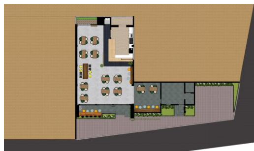
Gambar.3. Layout desain pertama