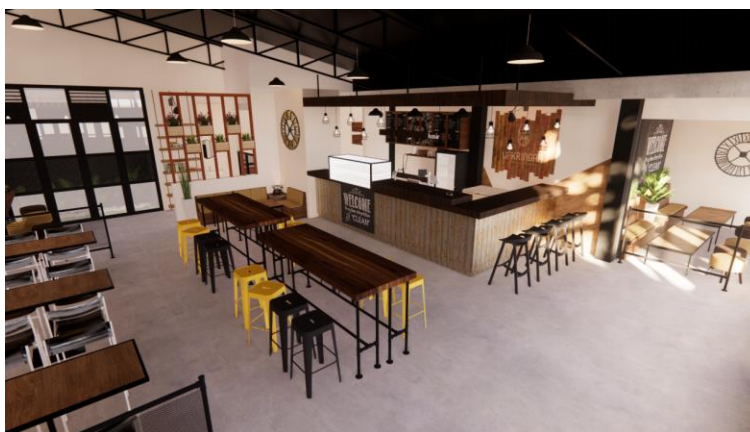
Gambar.20. Desain kelima area bar dan dapur bersih