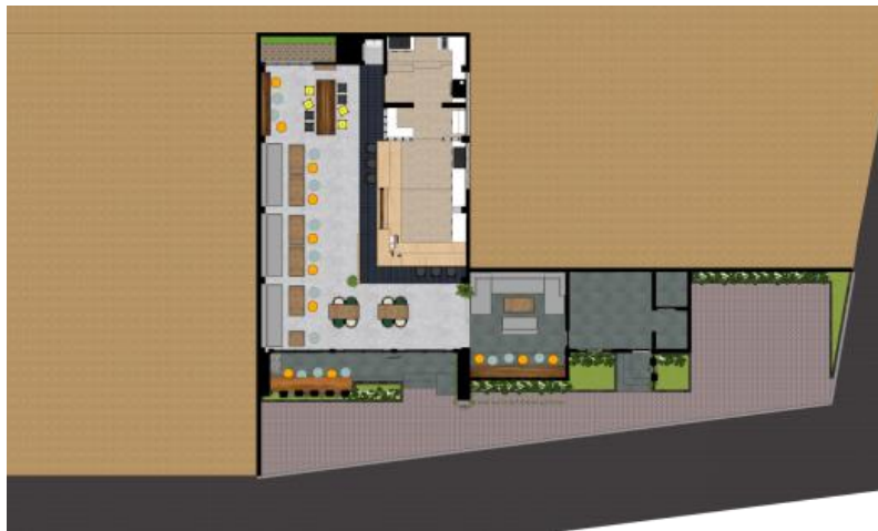
Gambar.7. Layout desain kedua