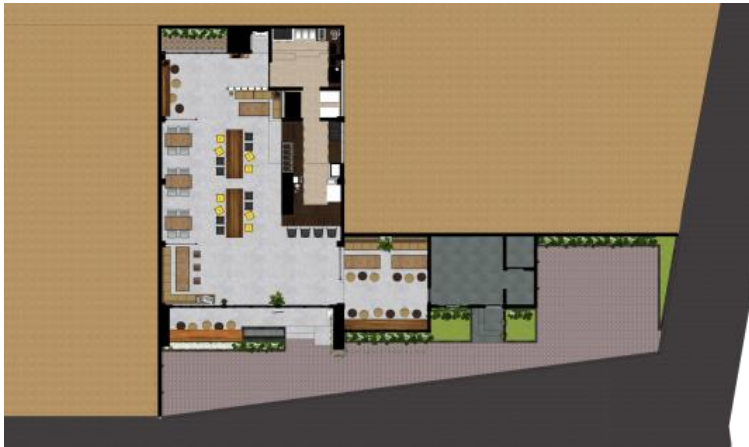
Gambar.19. Layout desain kelima