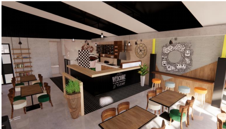
Gambar.4. Desain pertama area bar dan dapur bersih