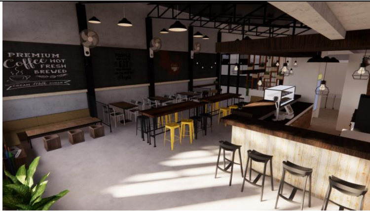
Gambar.21. Desain kelima ruang indoor bagian selatan