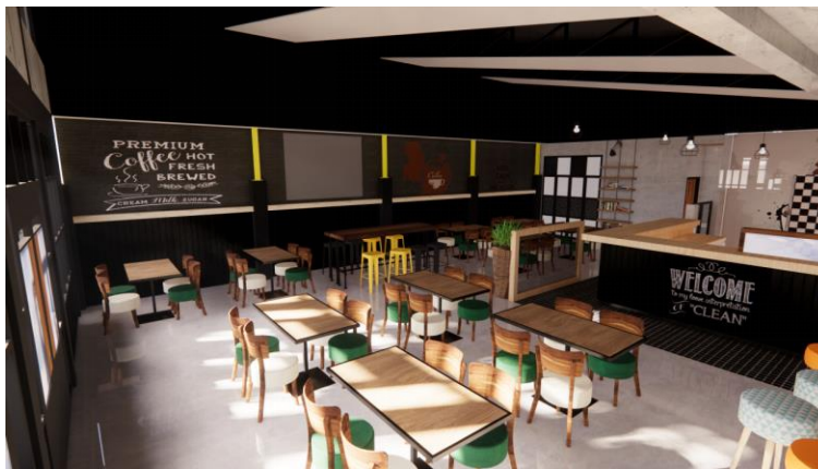
Gambar.5. Desain pertama ruang indoor bagian selatan