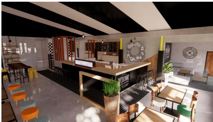
Gambar.8. Desain kedua area bar dan dapur bersih