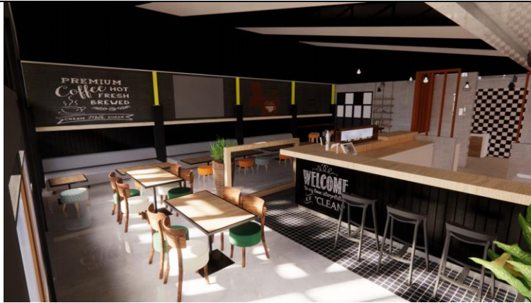
Gambar.9. Desain kedua ruang indoor bagian selatan