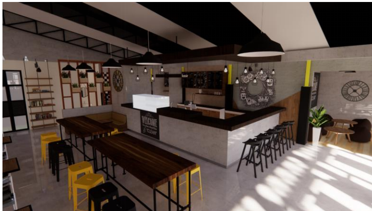
Gambar.16. Desain keempat area bar dan dapur bersih