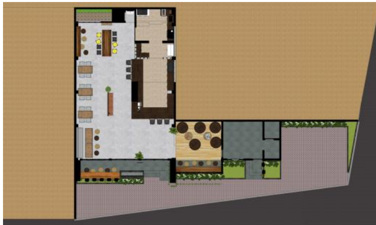
Gambar.11. Layout desain ketiga