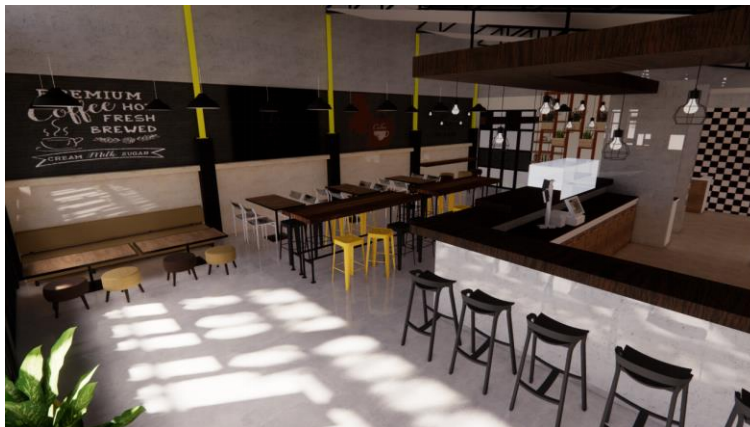
Gambar.17. Desain keempat ruang indoor bagian selatan