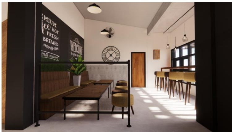
Gambar.22. Desain kelima ruang indoor bagian utara

Permasalahan: Area bar dirasa terlalu lebar dengan pertimbangan karyawan kafe yang hanya berjumlah kurang lebih 4 orang. Ada penambahan berupa showcase minuman di area bar, dan tempat untuk koran dan majalah, serta tempat payung di dalam ruangan. Beberapa furnitur dan material juga masih perlu disesuaikan kembali dengan konsep yang diinginkan.