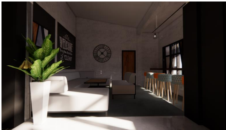
Gambar.10. Desain kedua ruang indoor bagian utara

Permasalahan: Layout furnitur terasa tidak nyaman dan ruang terkesan lebih sempit. Adanya tambahan kebutuhan ruang oleh klien.