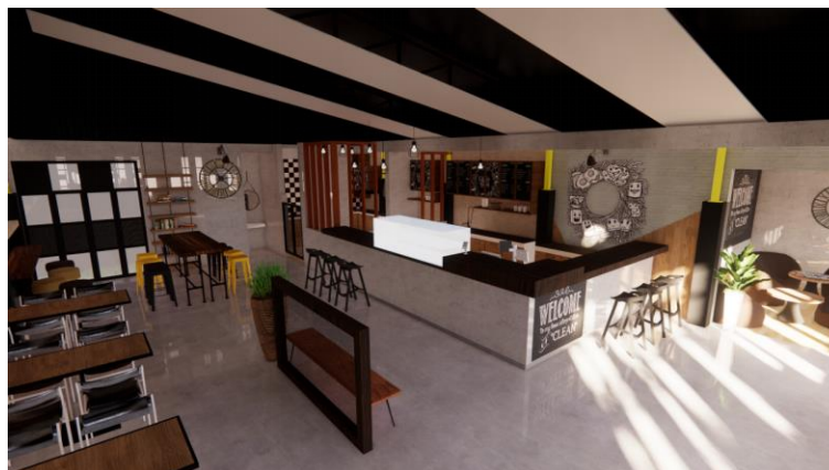
Gambar.12. Desain ketiga area bar dan dapur bersih