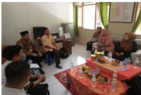
Gambar 3. Kegiatan Pendampingan

Pendampingan ini dilakukan oleh tim pelaksana dosen dan mahasiswa yang dimulai dari review RPP sebelumnya, diskusi rekonstruksi RPP berbasis OBE dan penyusunan RPP oleh guru masing-masing sekolah. Hasil review RPP sebelumnya menunjukkan bahwa tujuan pembelajaran adalah meningkatkan pemahaman siswa dan pengembangan jiwa kewirausahaan. Metode pembelajaran berupa tutorial dan pengerjaan tugas. Sedangkan, akselerasi proses pembelajaran dilakukan guna meningkatkan kualitas pembelajaran, meningkatkan minat berwirausaha dan memiliki sikap menjadi wirausaha mandiri nantinya. Rancangan RPP yang telah dilakukan adalah: