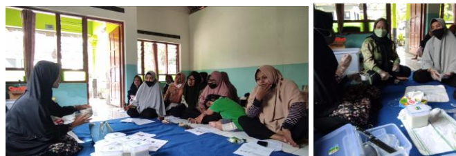
Gambar 1. Literasi halal dan proses pembuatan Salaghurt

Kegiatan berjalan interaktif dengan partisipasi aktif dari mitra (Gambar 1). Mitra tidak hanya menjadi peserta, tetapi juga berbagi pengalaman dan menjadi narasumber bagi sesama pelaku usaha. Praktik langsung di lokasi produksi memperlihatkan antusiasme tinggi, di mana mitra saling membantu menerapkan prinsip halal dalam proses pembuatan Salaghurt . Adanya bimbingan dari mitra yang sudah berpengalaman meningkatkan rasa percaya diri peserta lain untuk melakukan perubahan.