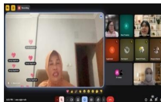
Gambar 1. Pelatihan secara online

Pelaksanaan Program Pengabdian Internasional berupa pelatihan manajemen pemasaran digital bagi peserta didik PKBM PPI Taiwan menunjukkan dampak positif terhadap peningkatan kompetensi kewirausahaan digital dan pemberdayaan ekonomi komunitas pekerja migran. Hasil program dianalisis berdasarkan peningkatan kompetensi peserta didik serta luaran produk digital yang dihasilkan melalui pendekatan partisipatif.