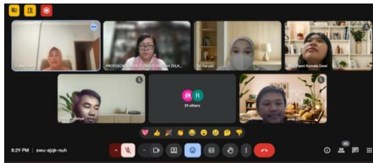
Gambar 4. Foto Bersama PMI di Taiwan

Program pengabdian ini memberikan dampak signifikan bagi komunitas diaspora Indonesia di Taiwan, ditunjukkan oleh meningkatnya kepercayaan diri peserta dalam memasarkan produk secara daring, pemanfaatan media sosial sebagai sarana bisnis, serta terbentuknya jejaring usaha kreatif antaranggota PKBM (Asari et al. , 2023). Dampak ini sekaligus memperkuat peran PKBM PPI Taiwan sebagai pusat pemberdayaan ekonomi, tidak hanya sebagai lembaga pendidikan nonformal. Temuan ini sejalan dengan World Bank (2020) yang menegaskan bahwa transformasi digital membuka peluang perdagangan lintas negara dan memperkuat ketahanan ekonomi usaha kecil. Melalui pemasaran digital, produk diaspora Indonesia memiliki peluang lebih besar untuk menjangkau pasar internasional secara berkelanjutan.