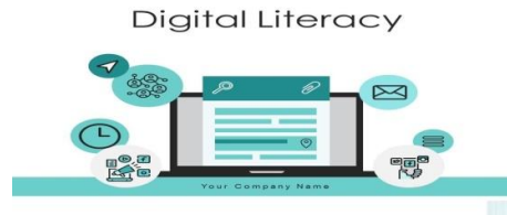
Gambar 2. Deskripsi Produk

Contoh praktik sesi 1: Peserta membuat deskripsi singkat produk, fokus manfaat dan sasaran pengguna.