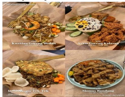
Gambar 3. Poster Digital Promosi Makanan

Gambar 2 menunjukkan praktik sesi 1, di mana peserta menyusun deskripsi produk dengan menekankan manfaat utama dan sasaran pengguna. Kegiatan ini merepresentasikan keterkaitan literasi digital dengan kemampuan komunikasi pemasaran, sehingga peserta tidak hanya memahami konsep tetapi juga mulai mengaplikasikan keterampilan dalam mengidentifikasi nilai produk dan menyampaikannya secara jelas. Pembelajaran interaktif terbukti meningkatkan partisipasi dan motivasi, sejalan dengan temuan tentang efektivitas desain pembelajaran daring yang dialogis (Hodges et al. , 2020). Pada sesi kedua, peserta menunjukkan perkembangan keterampilan melalui praktik strategi konten dan promosi digital. Dengan pendekatan partisipatif, peserta mampu merancang poster digital, caption persuasif, serta simulasi unggahan media sosial. Mereka juga membuat poster promosi menggunakan aplikasi sederhana seperti Canva dan PicsArt, sekaligus menjelaskan alasan pemilihan warna dan pesan promosi.